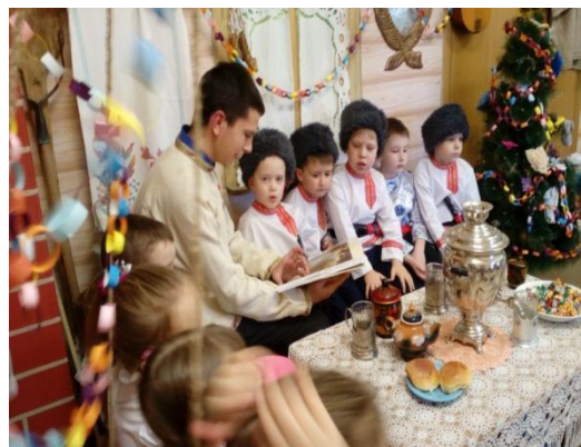
«Ни дня без книжки»