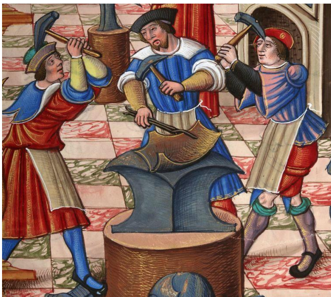
Мастер и подмастерье (Средневековый рисунок)

На данном изображении мы также видим форму применения методики сопровождения в обучении. Здесь мастер (в центре) является не наблюдателем, а активным участником образовательного процесса, совмещенного с трудовой деятельностью.