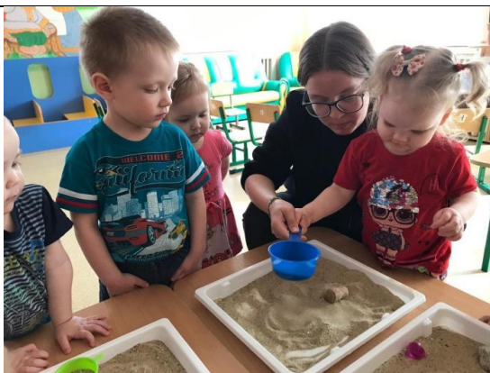
Знакомство со свойствами песка