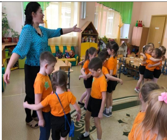
Ежедневный ритуал «Нежные игры»

Демонстрация опыта работы по технологии «Сегодня и ежедневно».