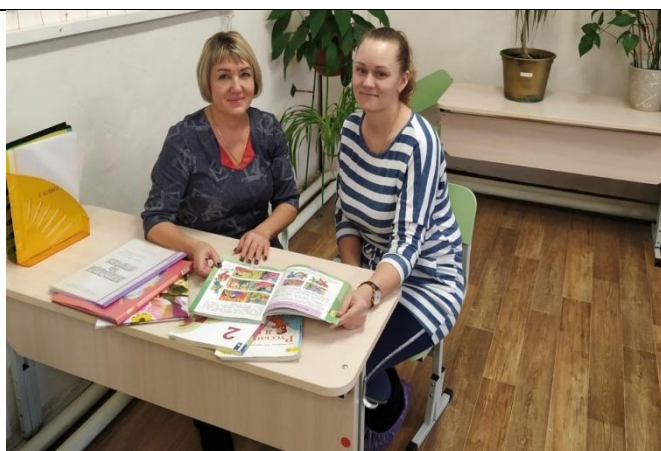
Смотрим и изучаем учебные пособия, проекты и технологические карты.