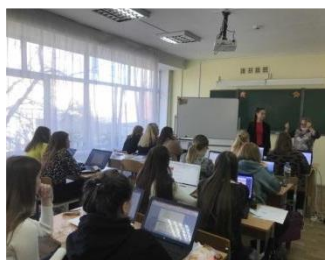
Рис. 2. встреча с участниками движения worldskills