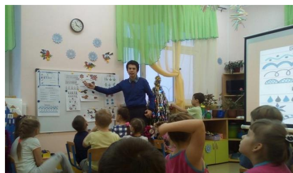
Знакомство с гжельской росписью