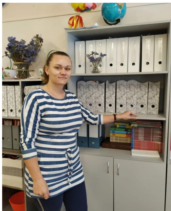
Знакомство с учебным кабинетом