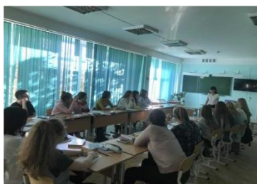
Рис. 1 Круглый стол совместно с социальными партнерами ДООУ и работодателями

Перспективой и практической значимостью является формирование успешных кейсов, практик для дальнейшей работы и расширение тандемов наставничества в 2022-2023 уч.году: «Студент-студент»; «Студент-работодатель».