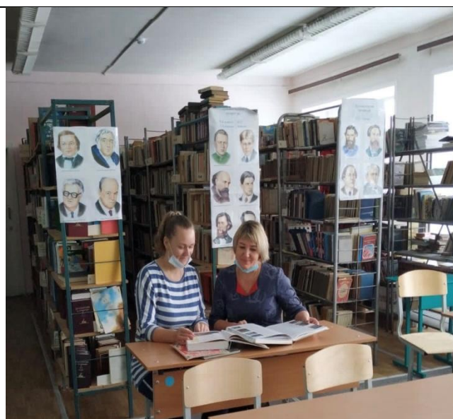
Изучаем методическую литературу