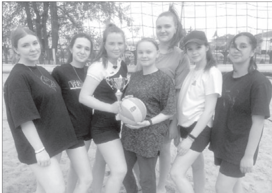
Победитель соревнований – команда 2 А группы педколледжа.