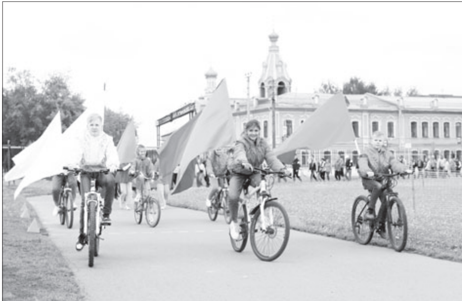
День России – праздник молодых, сильных, спортивных!