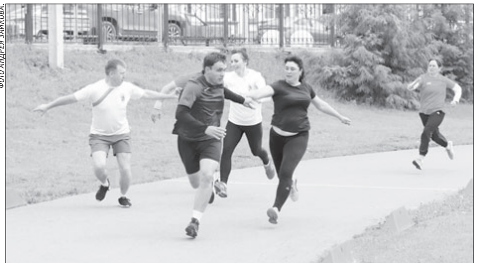
Эстафета 4х100: догнать и перегнать. ▶

Мужские команды состязались в стритболе – так называемом уличном баскетболе, где в команде только три игрока. В Камышлове уже появились настоящие любители и этого сравнительно нового вида спорта.