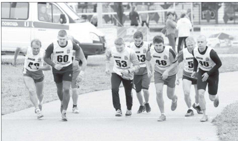
Открывали спартакиаду легкоатлетические старты.