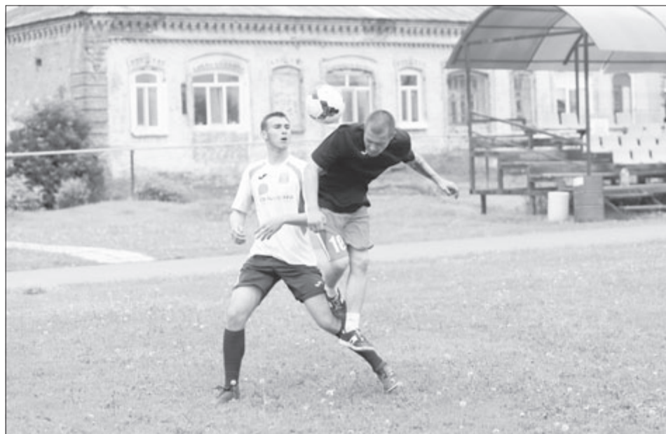
Футбольные баталии растянулись почти до вечера.