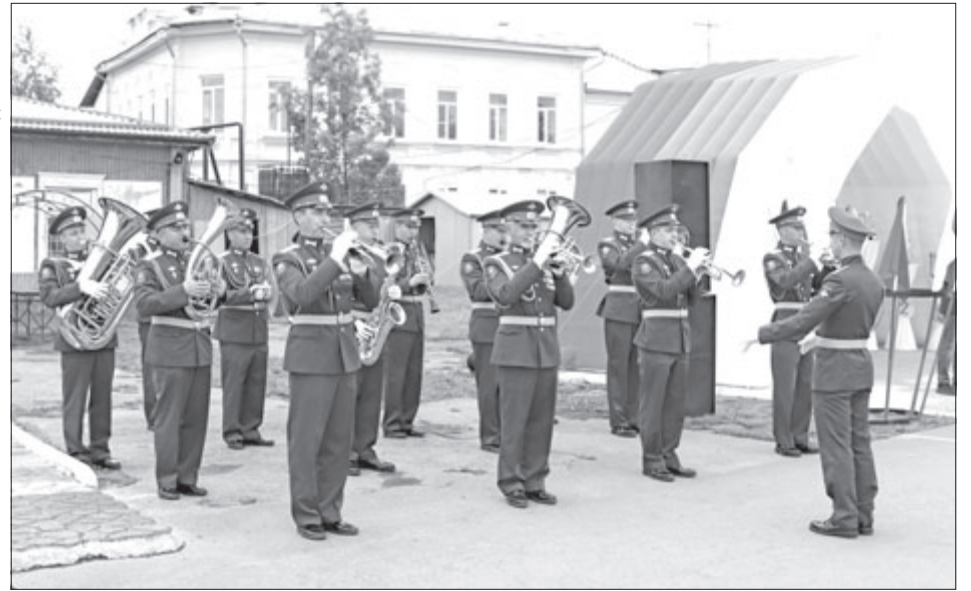
Большой неожиданностью для всех участников и зрителей стал сюрприз, подготовленный организаторами, – показательные выступления духового оркестра Еланского военного гарнизона.