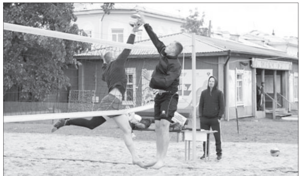
Пляжный волейбол – легко и красиво.