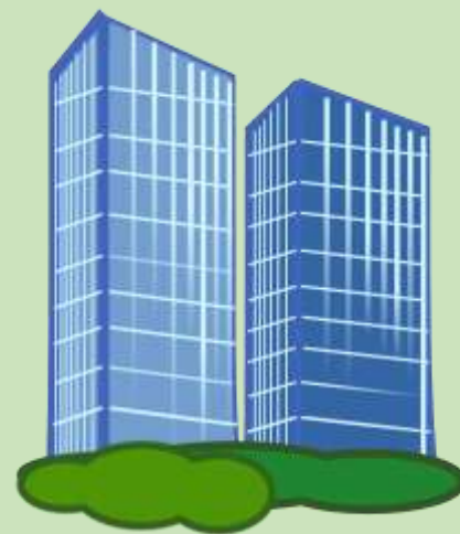
Предприятие или организация