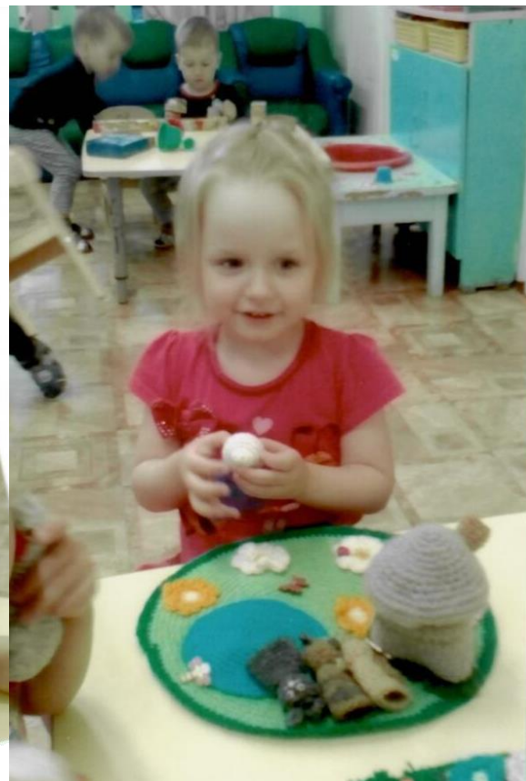
Показ театрализованной потешки