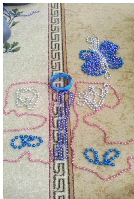
Процесс игры «Бусоград»