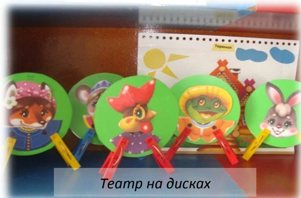
Театр на дисках

2. Следующий театр относится к верховым куклам, театр на палочках . Ими можно управлять за счёт палочки, на ширме. Я использую «подиум», где прячется кулачок и фигурки двигаются. Обводим трафарет выбранного героя, вырезаем, крепим палочку, дополняем мелкими деталями, герой готов.