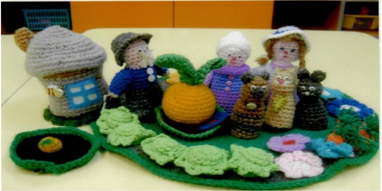
Напольный коврик-застегалочка по сказке