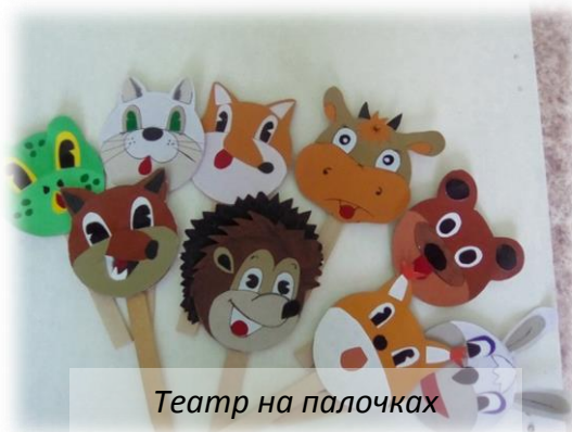
Театр на палочках