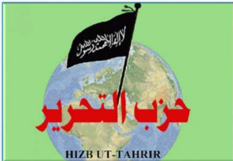
Хизб ут Тахрир аль Ислами