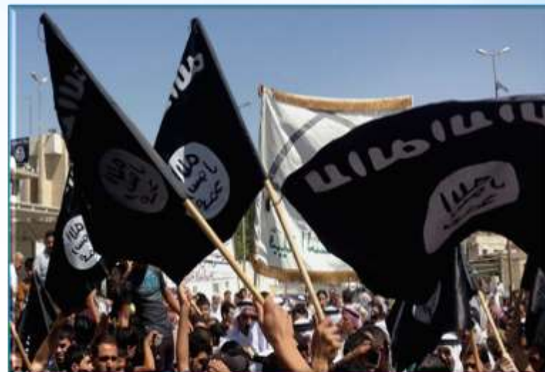
Исламское государство (ИГИЛ)